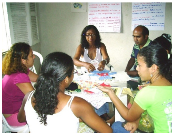
Participantes do Projeto Presenças refletem sobre sua prática em atividade artística

O FICAS vem aprimorando nesse Projeto o uso de vivências que trabalham várias dimensões humanas - artístico-criativa, afetiva e corporal - visando favorecer o debate entre os focais e a compreensão de conceitos. As vivências têm fortalecido a autoconfiança e transformação de cada participante, a criação de vínculos de confiança dentro do grupo e entre este e o FICAS. O objetivo é tornar sustentável a desafiadora transformação organizacional, que depende de cada focal mobilizar e envolver outros atores no processo.