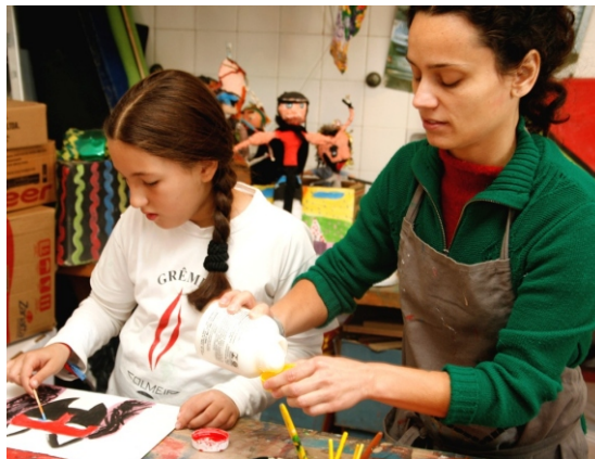
Educadora e educanda criam juntas em atividade na Colmeia

Para os/as educadores/a da Colmeia, um grande desafio da pedagogia da presença é extrapolar as fronteiras da sala de aula, cuidando do indivíduo e observando-o como um todo, com suas fraquezas, forças e complexidades. Para isso, é importante que exista diálogo e abertura entre educadores/as, pois é nessa troca que se constrói uma visão mais completa sobre o mesmo educando. Outro desafio é disseminar os conceitos e práticas da pedagogia da presença constantemente para toda equipe. Afinal, alinhar conceitos e práticas educativas é um aprendizado e uma necessidade constantes para que a educação propicie vez mais encontros verdadeiros e crescimento.